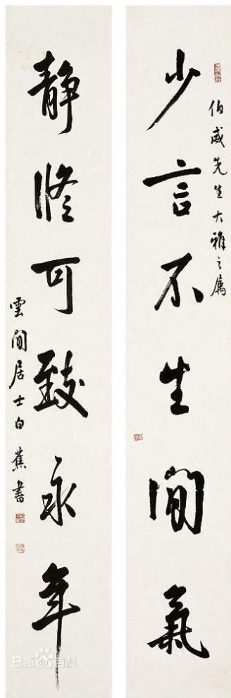
书法家白蕉（1907—1969）书写对联