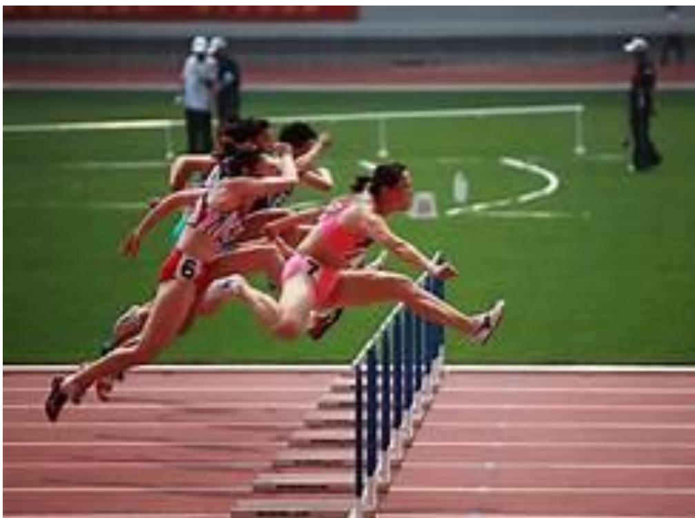
跨栏 --- 大运会一瞥