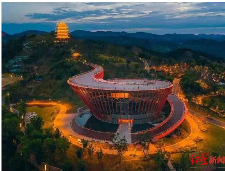
四川龙泉山城市森林公园