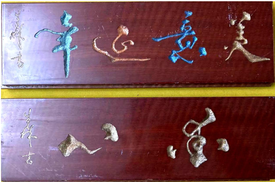
张幼矩:八旬回顾展作品(多选一) 主办单位:成都画院 ▼