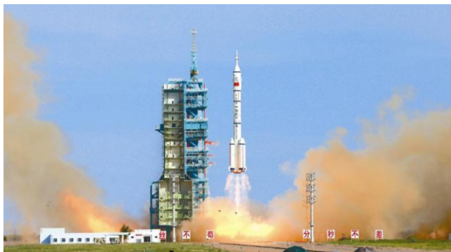
神舟十七点火升空