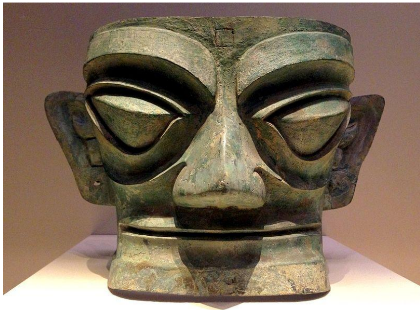
三星堆遗址出土青铜面具，在北京的国家博物馆展出。