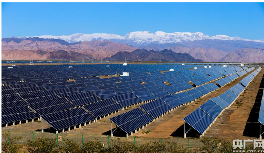
新疆太阳能光电厂